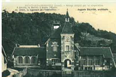
Mairie-école reconstruite de Sancy-les-Cheminots