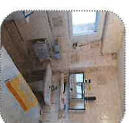
Adaptation au handicap et/ou au vieillissement