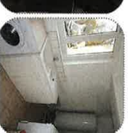
Réhabilitation de logements très dégradés et rénovation énergétique

Rénovation énergétique, adaptation au handicap et/ou au vieillissement