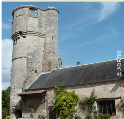
Tour du 15e siècle