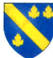
BUCY LE LONG