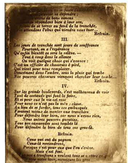
La chanson de Craonne

Ces mots sont les paroles d'une des chansons les plus connues de la Grande Guerre. Chantée sur un air populaire de la Belle Époque, elle a d'abord été déclinée en plusieurs versions antérieures à celle-ci (chanson de Lorette, de Vaux). Au printemps 1917, elle renaît sur le plateau de Craonne au Chemin des Dames, accompagnant le mouvement des «mutineries». Elle exprime, par des mots simples mais aussi empreints de révolte, la lassitude et le désespoir des soldats français face aux conditions de vie effroyables et aux innombrables pertes humaines.