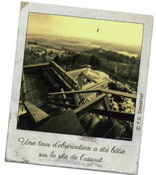
Une tour d'observation a été bâtie sur le site de l'assaut

D'abord, l'«élan splendide, irrésistible» des troupes françaises à l'assaut de la défense allemande. Puis aussitôt après, «le crépitement des mitrailleuses allemandes» nichées au sommet des pentes abruptes. Très rapidement, la progression des troupes françaises est enrayée. Les Allemands contre-attaquent immédiatement, débouchant de tunnels souterrains. Ils déciment les assaillants et défendent les boyaux menant au sommet.