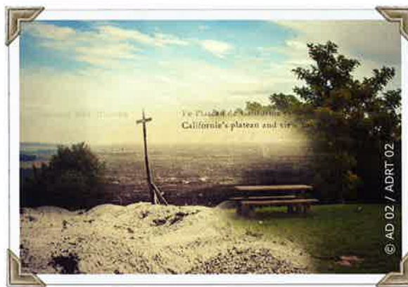
Le plateau de Californie : hier et aujourd'hui

Après l'échec du 16 avril 1917, un mouvement d'indiscipline appelé «mutineries» se manifeste parmi les soldats. Après une période de repos, les hommes refusent d'abord de remonter vers les lignes et pratiquent ensuite une forme de «grève des tranchées», assez comparable à un mouvement social du temps de paix. Certains «mutins» s'en prennent verbalement ou physiquement aux cadres qui les commandent. D'autres manifestent en défilant, tirent en l'air et demandent à être reçus par leurs officiers afin d'exprimer leurs revendications. Après 3 ans de guerre, ces refus d'obéissance obligent le commandement à écouter les revendications des soldats mais aussi à réprimer ce mouvement, en faisant exécuter une cinquantaine de «mutins».