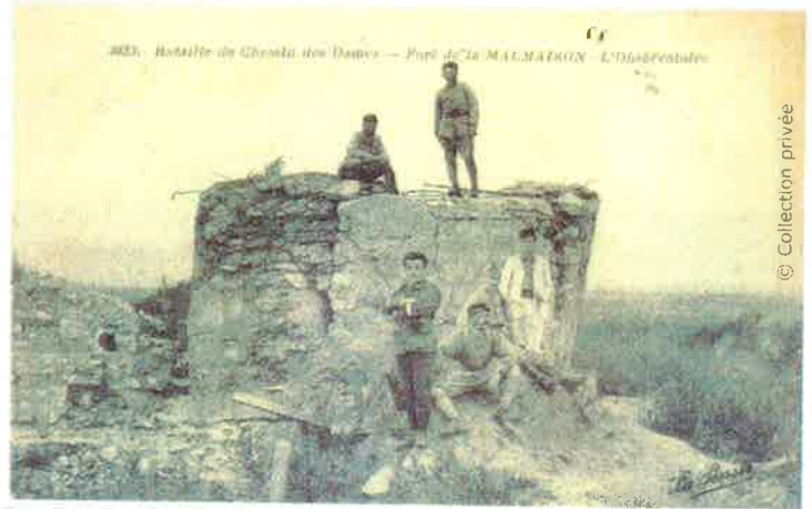
Fort de la Malmaison - L'observatoire

Le général Pétain, nommé commandant en chef depuis le mois de mai, décide de mener un engagement offensif bref mais très intense sur l'ouest du plateau, afin de reprendre son extrémité. Durant six jours, 1850 canons de tous calibres pilonnent les positions allemandes et leurs fortifications (fort de la Malmaison, blockhaus et creuttes). En l'espace de quelques jours, les troupes françaises appuyées par les chars parviennent à déloger les Allemands. La victoire française est nette et les pertes de l'armée allemande sévères : 8 000 tués, 3 000 blessés et 11 500 prisonniers. Les Allemands sont contraints d'abandonner l'ensemble du plateau pour se réfugier un peu plus au nord dans la vallée de l'Ailette.