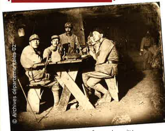
Soldats dans les souterrains de la Caverne du Dragon

La portion de plateau que vous parcourez ici est occupée par les Allemands depuis les premiers mois de la guerre. Ces derniers l'ont nommée le Winterberg (la montagne de l'hiver). De vastes carrières souterraines offrent aux hommes des refuges à l'abri des intempéries et des bombardements. Mais les compagnies du génie allemand vont également percer le plateau de nombreux tunnels, permettant aux soldats de le traverser sans le moindre encombre. Ces ouvrages souterrains les autorisent aussi à amener rapidement des renforts et du matériel de combat, sans avoir à subir les effets des bombardements de l'artillerie française. C'est en prenant pied dans ces tranchées situées en rebord de plateau que les Français découvriront l'importance, le perfectionnement mais aussi et surtout, l'efficacité des dispositifs souterrains allemands.