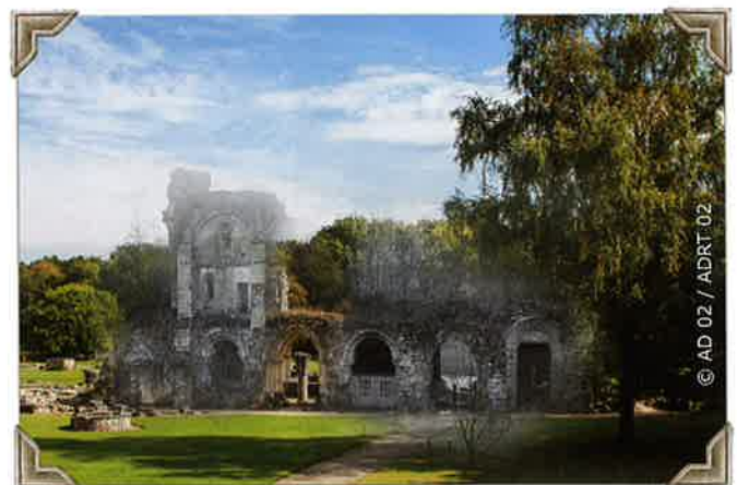
Vaucclair hier et aujourd'hui

Toutefois, quelques jours après la prise de ce cliché de repérage, c'est l'artillerie lourde à longue portée des Français qui réduira à l'état de ruines ce grand bâtiment préservé jusqu'alors.