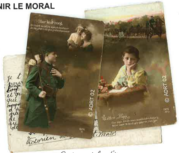
Cartes postales d'époque

La génération des soldats qui partent à la guerre en 1914 a été massivement scolarisée et ce, depuis l'avènement des lois Ferry de 1882. La lecture du courrier et l'écriture de lettres occupent donc une place essentielle dans leur vie sur le front. Non seulement la correspondance permet de prendre des nouvelles des proches et des enfants qu'il a fallu quitter, mais elle autorise également les hommes à poursuivre la gestion de leurs biens. Nombre de soldats d'origine paysanne peuvent ainsi conseiller et guider leurs épouses pour mener à bien les travaux de la ferme. On estime à 4 millions le nombre de lettres qui arrivent tous les jours sur le front. Sans oublier les colis qui apportent aux soldats quelques douceurs venues de leur contrée et qu'ils partagent, la plupart du temps, avec les «copains».