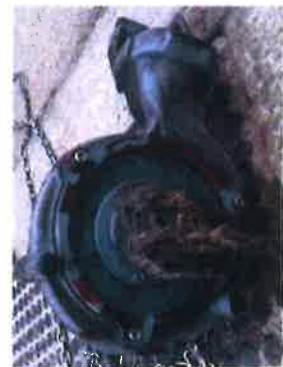
Exemple de pompe bouchée aux lingettes

Elles forment alors des bouchons dans les réseaux d'eaux usées.